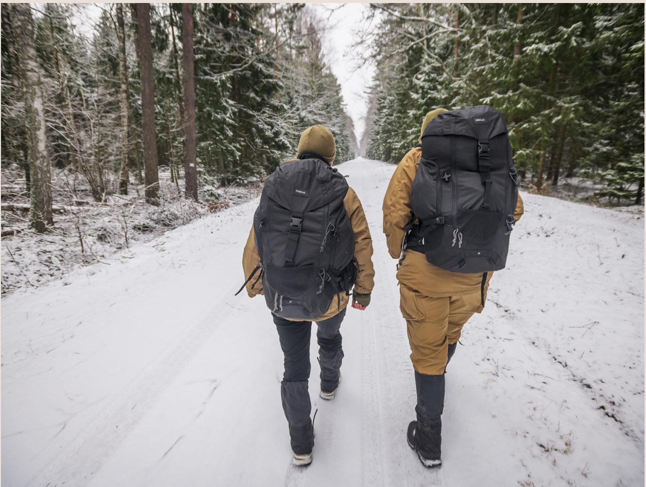
Pracownicy humanitarni dostarczający pomoc na granicy polsko-białoruskiej.

Według znanego porzekadła podobno nie ma głupich pytań, są jednak na pewno takie, które nie pomagają nam w opisywaniu świata i realnych wyzwań przed nami stojących. Przykładowo: jesteś za czy przeciw migracji/uchodźcom? To tak jakby spytać, czy jest się za czy przeciw gospodarce. Dużo ciekawsza będzie rozmowa o tym, jakiej gospodarki chcemy lub jak wygląda obecnie sytuacja osób migrujących. Jakie procedury mogą zapewnić sprawiedliwy dostęp i weryfikację dla osób ubiegających się o ochronę międzynarodową, a jednocześnie dać reszcie społeczeństwa poczucie bezpieczeństwa? Migracje były, są i będą. Strach przed osobami przemieszczającymi się i próba ograniczania tych działań, to zjawiska stosunkowo nowe. Mam nadzieję, że ta publikacja zachęciła Was do aktywnej refleksji nad tym, dlaczego tak jest i jak inaczej mogłoby to wyglądać.