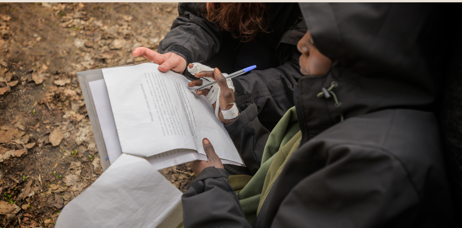
19-latką z Sudanu wypełnia dokumenty deklarujące wolę ubiegania się o ochronę międzynarodową w Polsce.

Większość osób uciekających przed konfliktami i prześladowaniami pozostaje w pobliżu swojego kraju pochodzenia. Odsetek uchodźców i uchodźczyń przyjmowanych przez sąsiednie państwa to ok. 70%. Na całym świecie zdecydowana większość z nich jest goszczona przez kraje o niskich i średnich dochodach, czyli nie te najbardziej uprzywilejowane. Czy wiedzieliście, że Uganda gości więcej osób uchodźczych niż Polska? Przeanalizujcie więcej statystyk na stronie UNHCR .